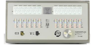
20 Centraline hot runner