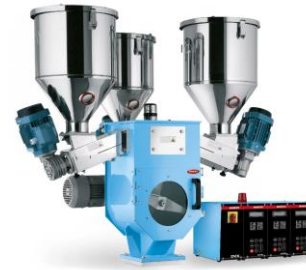
10 Impianti dosaggio