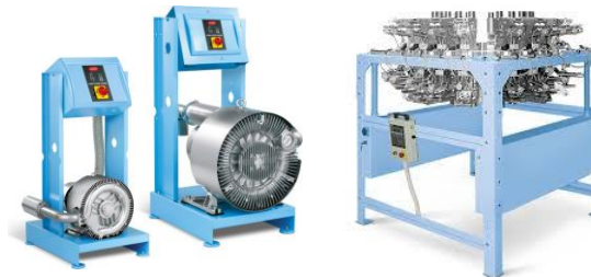
64 ricevitori trasporto materiale